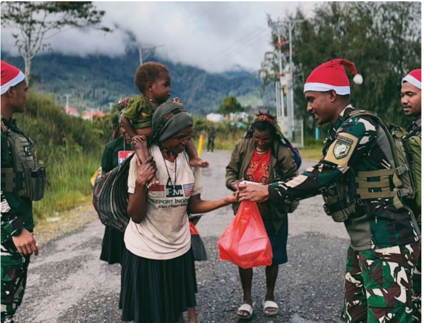
Foto: Satgas Yonif 509 Kostrad memberikan makna baru pada patroli keamanan dengan berbagi kebahagiaan bersama masyarakat di Intan Jaya, Papua.

PAPUA- Dalam balutan semangat Natal yang damai, Satgas Yonif 509 Kostrad memberikan makna baru pada patroli keamanan dengan berbagi kebahagiaan