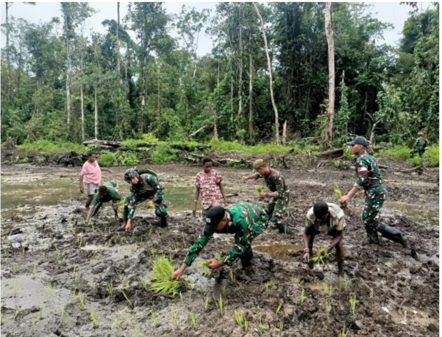
Foto: Satgas Pamtas Mobile RI-PNG Yonif 503/Mayangkara menggagas program ketahanan pangan yang melibatkan langsung warga Kampung Mumugu, Distrik Krepkuri, Kabupaten Nduga, Selasa (07/01/2025).

NDUGA- Dalam upaya membangun kesejahteraan masyarakat di wilayah penugasan Papua Pegunungan, Satgas Pamtas Mobile RI-PNG Yonif 503/Mayangkara